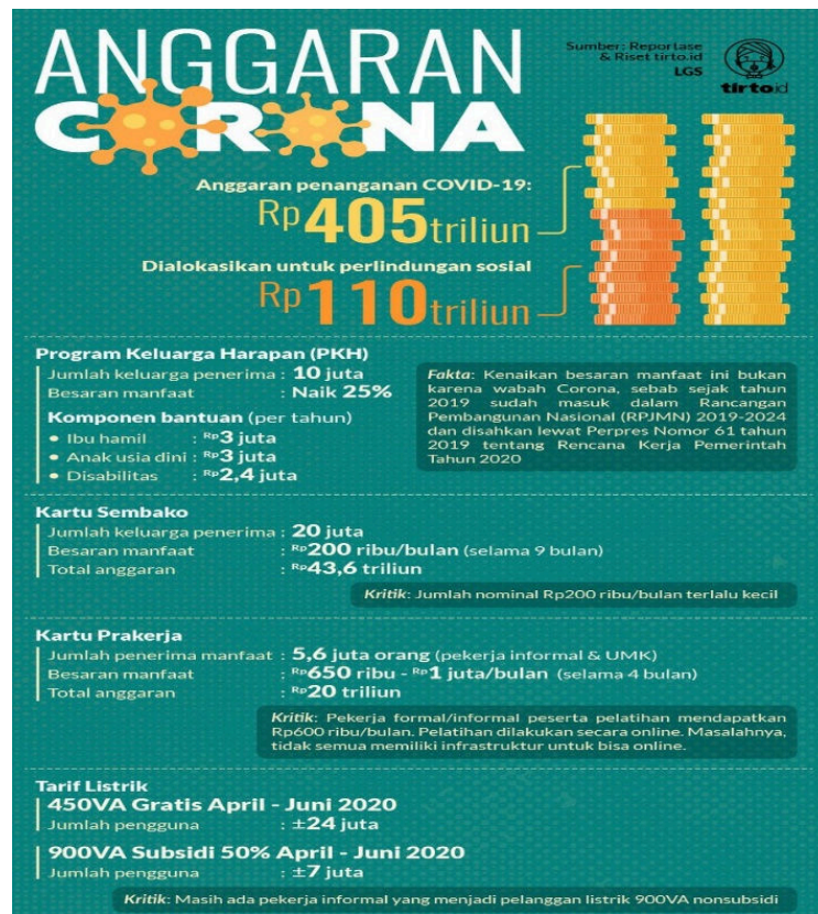
Gambar 1. Anggaran Corona Tahun 2020