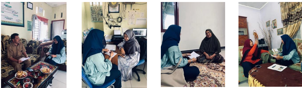
Gambar 3. Dokumentasi wawancara bersama masyarakat

Berdasarkan Tabel 1 dapat diketahui bahwa mata pencaharian penduduk di Desa Damaran Baru yang paling banyak adalah sebagai petani yang berjumlah 185 jiwa, mata pencaharian sebagai pedagang yaitu berjumlah 8 jiwa, pegawai negeri sipil 38 jiwa, pensiunan 3 jiwa dan 537 jiwa lainnya terdiri dari masyarakat yang tidak bekerja, seperti ibu rumah tangga, lansia, pelajar/mahasiswa, anak-anak serta buruh lepas. Penelitian ini menggunakan informan berjumlah 10 orang dan berlangsung selama 2 hari yaitu tanggal 23 - 24 Januari 2023. Pengambilan data dilakukan dengan menggunakan metode wawancara yang berisi pertanyaan-pertanyaan yang menjadi acuan dalam pengambilan data yang akan diolah dari hasil wawancara tersebut yang akan menyimpulkan Dampak Pariwisata ecovillage Terhadap Perekonomian Masyarakat Desa Damaran Baru Kabupaten Bener Meriah.