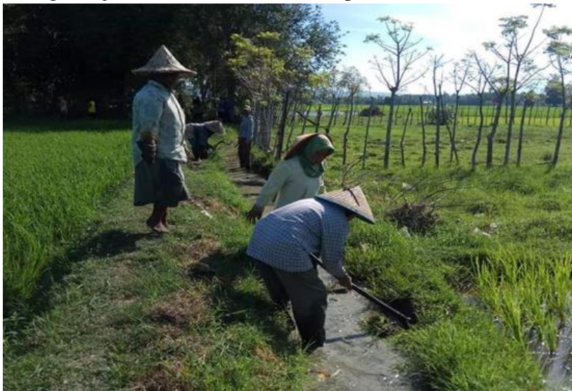
Gambar 2. Petani membersihkan saluran air

Kewenangan ini meliputi bidang pertanian, pengairan, penyerahan dan transaksi persawahan, lingkungan hidup, pembuatan dan pelaksanaan lembaga adat Keujruen Blang , serta penyelenggaraan sistem yudisial untuk mempertahankan adatnya. Menurut hukum adat yang mewakili budaya negara, semua kewenangan berada dalam lembaga adat Keujreun Blang . Mengingat posisi Keujreun Blang didasarkan pada pemilihan, maka kewenangan yang dipusatkan di satu tangan sedemikian rupa tidak selalu sama dengan otoritarianisme. Selain itu, mengingat lembaga adat Keujreun Blang mengurus masyarakat tani dengan kepedulian dan kekuasaan tersebut tidak dapat dicirikan berada di luar demokrasi. Anggota masyarakat selalu diberi tahu tentang kebijakan baru atau memiliki opsi untuk diberi tahu (Kiawan Andri, 2017).