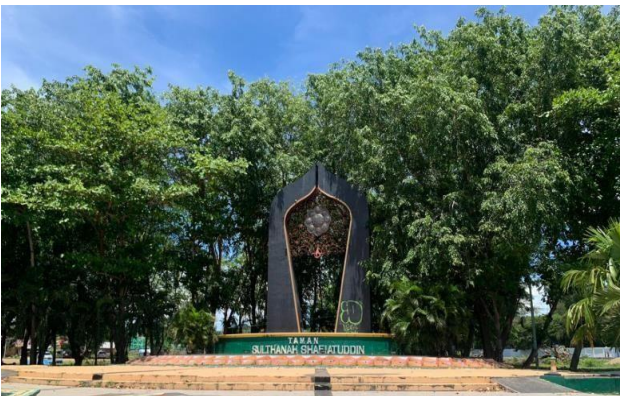
Gambar 4. Wisata budaya Taman Sulthanah Safiatuddin.

Zona budaya berpusat di Taman Sultanah Shafiatuddin, yang berfungsi sebagai ruang publik untuk berbagai kegiatan seni dan budaya. Berdasarkan hasil observasi, taman ini menjadi tempat yang strategis untuk acara budaya, seperti pertunjukan tari tradisional dan festival seni. Gambar 4 memperlihatkan bagaimana taman ini telah digunakan sebagai ruang interaksi masyarakat.