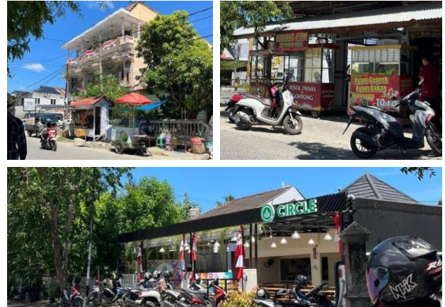
Gambar 5. Wisata kuliner di sepanjang Jalan Gabus, Lampriet.

Zona ini berada di Jalan Gabus, yang dikenal dengan berbagai warung kopi dan makanan khas Aceh. Gambar 5 menunjukkan aktivitas ekonomi yang ramai di kawasan ini, terutama pada malam hari. Berdasarkan wawancara dengan pemilik usaha, bisnis kuliner di area ini berkembang pesat dan menjadi daya tarik utama wisatawan.