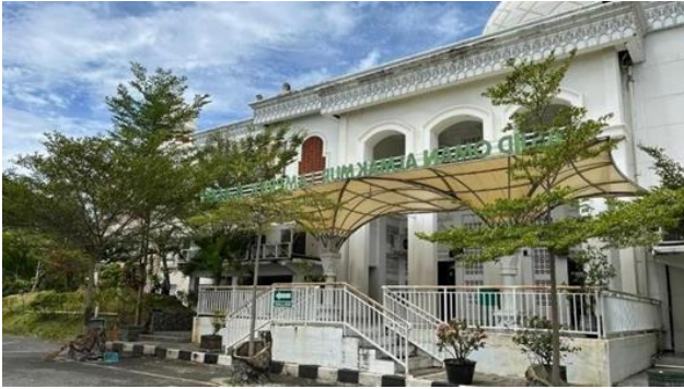
Gambar 3. Wisata religi Masjid Oman Al-Makmur.

Namun, hasil observasi mengindikasikan bahwa fasilitas pendukung seperti papan informasi, tempat parkir, dan jalur pedestrian masih kurang memadai. Studi Ardhana menekankan bahwa pengelolaan wisata religi yang baik harus mencakup fasilitas yang ramah pengunjung agar dapat meningkatkan kenyamanan wisatawan dan memperpanjang durasi kunjungan [8].