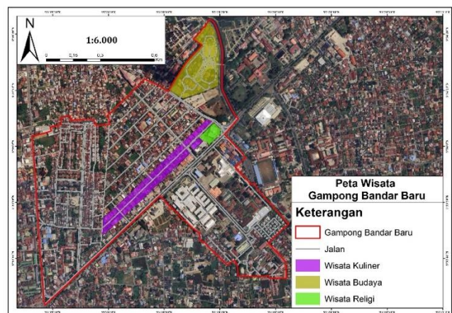
Gambar 2. Peta zona wisata Gampong Bandar Baru.

Hasil observasi dan pemetaan menunjukkan bahwa Gampong Bandar Baru memiliki tiga zona utama yang dapat dikembangkan sebagai kawasan wisata berbasis komunitas.