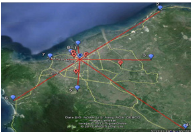
Gambar 2. Lokasi Pengukuran Kuat Medan terhadap Stasiun Pemancar Radio FM di Kota Banda Aceh

Dari Gambar 2, titik berwarna biru merupakan lokasi pengukuran kuat medan yang ditandai dengan angka. Angka 0 adalah titik 0 km Banda Aceh, angka 1 arah Utara adalah Gampong Jawa, angka 2 arah Timur Laut adalah Neuhen, angka 3 arah Timur adalah Cot Keueng, angka 4 arah Tenggara adalah Indrapuri, angka 5 arah Selatan adalah Darul Imarah, angka 6 arah Barat Daya adalah