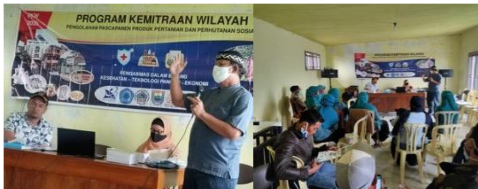
Gambar 3. Penyuluhan bidang ekonomi.

motivasi masyarakat Desa Gerlang untuk mengolah lebih lanjut produk pertaniannya sehingga memiliki nilai ekonomi yang lebih tinggi. Penyuluhan bidang ekonomi juga menjelaskan keuntungan pengolahan pasca panen produk pertanian kentang dibandingkan bila kentang dijual langsung tanpa dilakukan pengolahan. Pengolahan lebih lanjut produk pertanian akan menghasilkan diversifikasi produk kentang, sehingga dimasa yang akan datang bisa menjadi produk khas daerah dan menjadi jajanan untuk oleh-oleh khas Desa Gerlang.