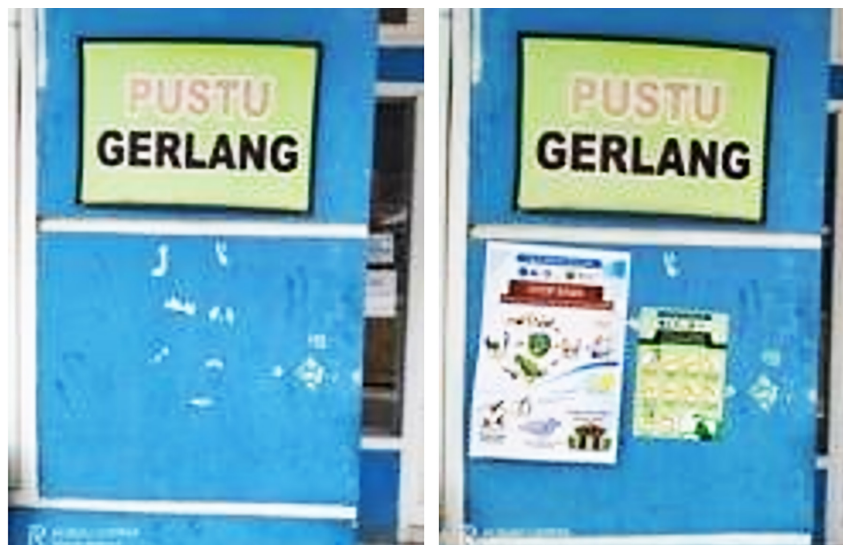
Gambar 5. Inisiatif masyarakat dalam kampanye hidup sehat. Sebelum pemasangan (kiri), setelah pemasangan (kanan) poster di Puskesmas Pembantu (Pustu) Desa Gerlang.

Program pengabdian ini juga berdampak pada kesadaran masyarakat untuk melakukan kampanye hidup sehat, hal ini ditunjukkan pada pemasangan poster “10 langkah cuci tangan yang benar” dan poster “STOP Buang Air Besar Sembarangan” (Gambar 5).