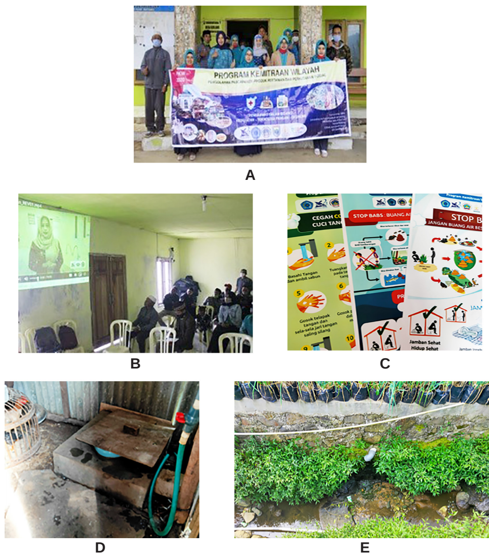
Gambar 1. (A) Team PKW Unimus dan panitia, (B) Presentasi sanitasi, (C) Leaflet cuci tangan dan jamban sehat, (D) Contoh jamban penduduk, dan (E) Saluran pembuangan limbah jamban

Pelaksanaan kegiatan penyuluhan yang dilanjut rapat bersama dilakukan pada tanggal 25 Juli 2020 dihadiri oleh Kades dan warga dari KTH (7 pedukuhan), perwakilan elemen PKK (Pemberdayaan Kesejahteraan Keluarga), Puskesmas, dan LSM GEMA (Gerakan Masyarakat Kehutanan Sosial) (Gambar 1).