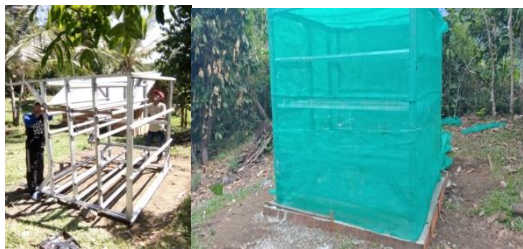
Gambar 1. Pembuatan Green House

Pelatihan dan penerapan teknologi ini dilakukan melalui beberapa tahapan, yaitu pembangunan rumah fodder ( green house ) dengan ukuran 2x2x2 meter dengan model vertikal (3 tingkat rak nampan/ tray ) dan instalasi air dengan sistem aeroponik (pengabutan) ( Gambar 1 ).