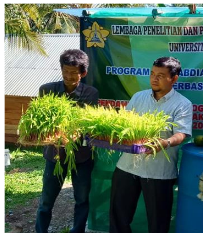
Gambar 3. Produk hidroponik fodder

Hasil luaran yang dicapai dari pelaksanaan program pengabdian kepada masyarakat ini adalah produk dan sistem budidaya hidroponik fodder jagung. Produk hidroponik fodder jagung merupakan hijauan pakan ternak yang dihasilkan melalui proses budidaya jagung selama 14 hari secara hidroponik di dalam green house ( Gambar 3 ).