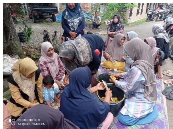
Gambar 5. Kegiatan pembuatan liquid kompos Kelompok Wanita Tani Udeep Mandiri di Gampong Bueng Pageu Kecamatan Blang Bintang Kabupaten Aceh Besar

Liquid kompos yang dihasilkan dari kegiatan PKMBP ini sejumlah 50 L yang semuanya dipakai sendiri oleh mitra baik untuk memupuk tanaman ataupun dipergunakan sebagai dekomposer dalam pembuatan solid kompos. Untuk memproduksi liquid kompos sebanyak itu diperlukan modal awal sekitar Rp 25.000. Jika disepadankan dengan harga EM-4 yaitu Rp 35.000 per liter, maka nilai ekonomi liquid kompos yang diproduksi petani Gampong Bueng Pageu diperkirakan mencapai Rp 1.750.000.