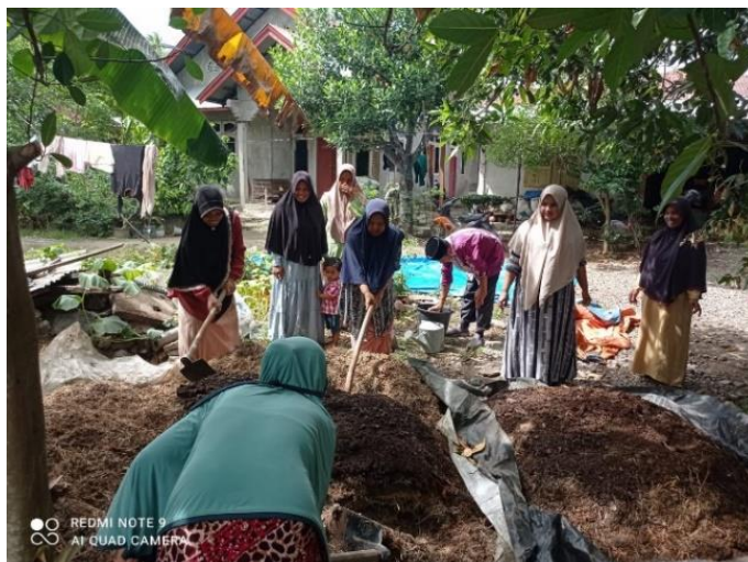
Gambar 4. Pelaksanaan pembuatan solid kompos Kelompok Wanita Tani Udeep Mandiri di Gampong Bueng Pageu Kecamatan Blang Bintang Kabupaten Aceh Besar