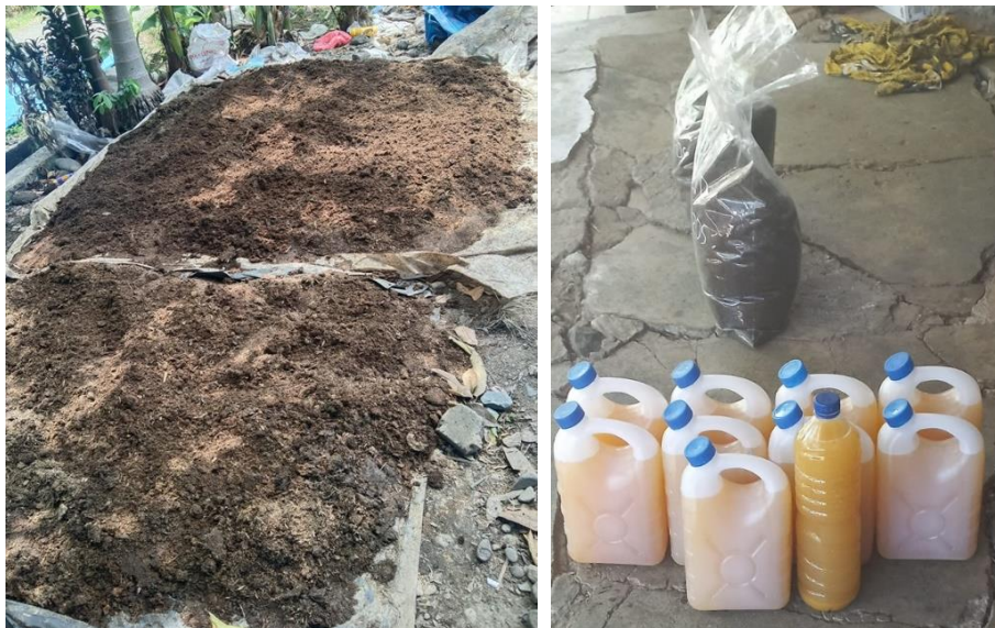
Gambar 6. Produk solid dan liquid kompos kegiatan PKMBP Tahun 2023 di Gampong Bueng Pageu Kecamatan Blang Bintang Kabupaten Aceh Besar

lainnya menjelaskan bahwa penggunaan MOL dapat meningkatkan pertumbuhan dan komponen hasil kacang panjang dengan dosis optimum 75 cc/L (Zulputra 2018). Adapun solid dan liquid kompos yang diproduksi dalam kegiatan PKMBP tahun 2023 di Gampong Bueng Pageu dapat dilihat dalam Gambar 6.