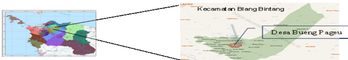
Gambar 1. Peta Lokasi kegiatan PKMBP Pembuatan solid dan liquid kompos Untuk Mewujudkan Pangan Lestari Gampong Bueng Pageu Kecamatan Blang Bintang Kabupaten Aceh Besar Tahun 2023

Pengabdian kepada Masyarakat ini berlangsung di Gampong Bueng Pageu Kecamatan Blang Bintang Kabupaten Aceh Besar Provinsi Aceh sebagaimana disajikan dalam Gambar 1 . Adapun Tahapan yang ditempuh sebagai solusi atas permasalahan spesifik yang dihadapi oleh PPL dan anggota kelompok Wanita tani Gampong Bueng Pageu dilaksanakan dengan langkah-langkah sebagaimana diringkas dalam Gambar 2 .