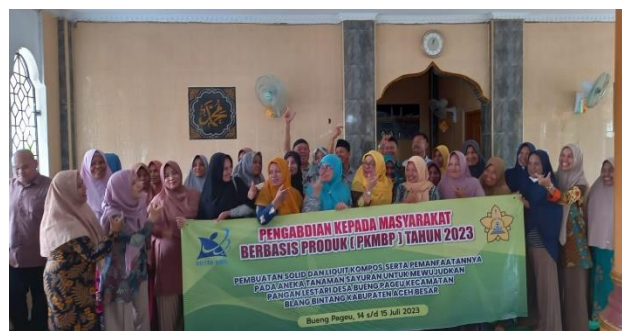
Gambar 3. Pelaksanaan Pelatihan Pembuatan solid dan liquid kompos Gampong Bueng Pageu Kecamatan Blang Bintang Kabupaten Aceh Besar