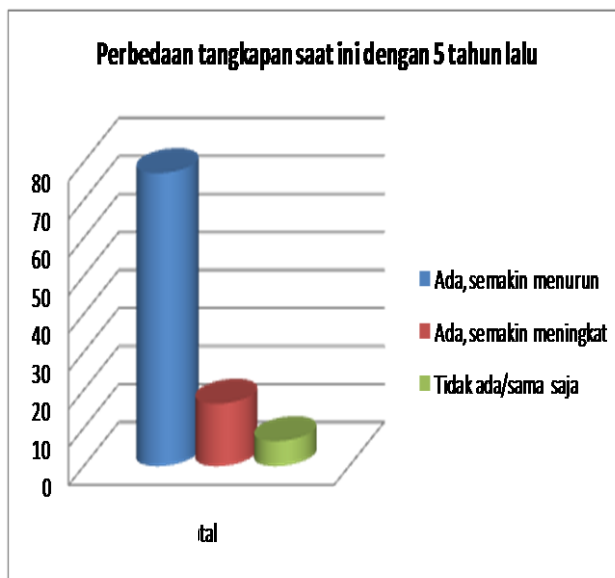
Gambar 2. Persepsi masyarakat nelayan terhadap hasil tangkapan ikan.