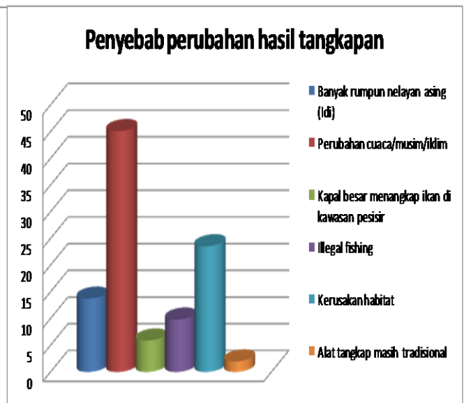
Gambar 3. Persepsi masyarakat terhadap penyebab perubahan hasil tangkapan ikan selama beberapa tahun terakhir.