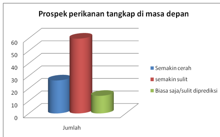
Gambar 6. Persepsi nelayan responden terhadap kondisi perikanan tangkap dimasa depan.

Dalam masa sulit seperti itu umumnya nelayan mengandalkan pinjaman (berhutang) kepada toke bangku (tengkulak) dengan imbalan hasil tangkapan mereka harus dijual kepada toke bangku berkenaan, kondisi ini menyebabkan mereka selalu terjat dan sulit melepaskan diri dari sistim ijon tersebut. Oleh karena itu dimasa depan program insentif perikanan Aceh Besar untuk sektor perikanan tangkap harus diarahkan untuk peningkatan kapasitas nelayan terutama introduksi dan diversifikasi ketrampilan yang produktif baik untuk nelayan maupun untuk keluarga mereka. Oleh karena itu lebih dari 50% responden menyatakan bahwa usaha perikanan tangkap dimasa depan akan semakin sulit (Gambar 6).