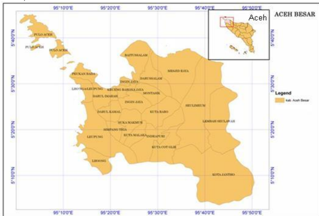
Gambar 1. Peta Kabupaten Aceh Besar

Penelitian ini dilakukan pada mulai Juni sampai Agustus 2012. Survey lapangan dilaksanakan pada 21-28 Juni 2012. Lokasi survey meliputi lima kecamatan di Aceh Besar, yaitu: (1) Baitussalam, (2) Mesjid Raya, (3) Leupung (4) Lhoknga dan (5) Mesjid Raya (Gambar 1).