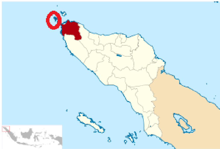
Gambar 1. Peta Provinsi Aceh dan Kabupaten Aceh Besar (arsiran warna coklat) yang menunjukkan lokasi penangkapan ikan sampel di wilayah Pulo Aceh (bulatan merah)

Penentuan spesies ikan target dilakukan berdasarkan hasil survei pendahuluan, yaitu dengan mengamati hasil tangkapan yang dominan oleh nelayan dari Famili Serranidae. Hasil pengamatan menunjukkan bahwa Plectropomus leopardus , P. laevis , P. maculatus , Epinephelus fuscoguttatus dan E. bleekeri adalah ikan dominan dalam Famili Serranidae dan sering tertangkap di Perairan Pulo Aceh Kabupaten Aceh Besar, dan menjadi ikan target dalam penelitian ini.